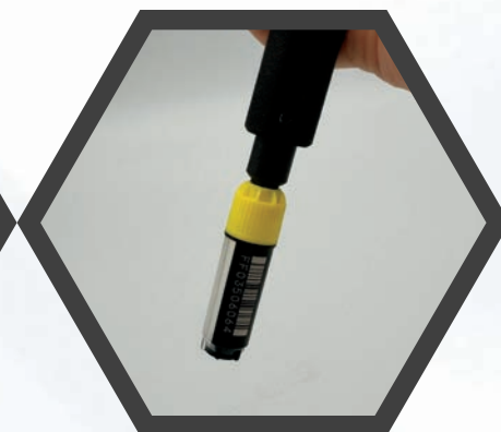
チューブピッカー ET-PK1+専用ヘッド

ハンズフリー、ストレスフリーで 読み取れる高性能スキャナー 一次元・二次元コード対応