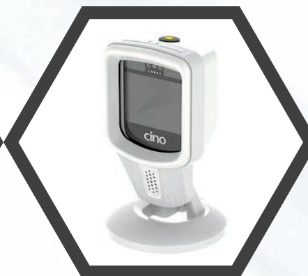
バーコードスキャナー ES-680

唯一無二の二次元バーコードが 底面と側面に刻印された、 ラック入検体保管用チューブ